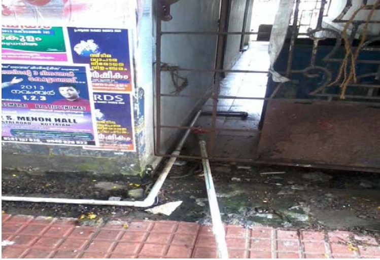
ഇ-ടോയ്ലെറ്റ് - വാട്ടർ കണക്ഷൻ മീറ്റർ തകർക്കപ്പെട്ട നിലയിൽ