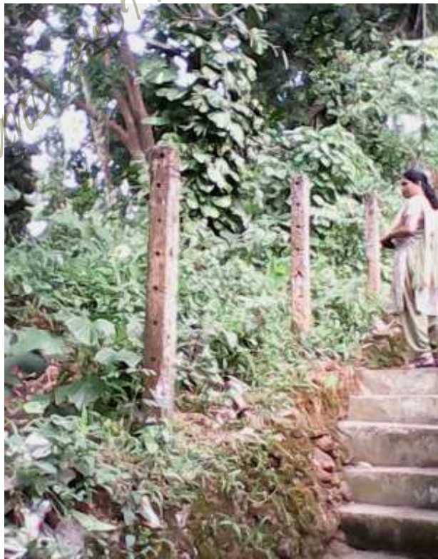
വനിതാ ഹോസ്റ്റൽ നിർമ്മാണത്തിന് വാങ്ങിയ സ്ഥലം

നഗരത്തിലെത്തുന്ന വനിതകൾക്ക് കോട്ടയം പട്ടണത്തിൽ കുറഞ്ഞ ചെലവിൽ താമസ സൗകര്യം ലഭ്യമാക്കുന്നതിനുവേണ്ടി കുര്യൻ ഉതുപ്പു റോഡിൽ ഇൻഡോർ സ്റ്റേഡിയത്തിനോട് ചേർന്ന് മുനിസിപ്പാലിറ്റി വക സ്ഥലത്ത് (66.65 സെന്റ്) വനിതാ ഹോസ്റ്റൽ നിർമ്മിക്കുന്നതിനായി സ്കെച്ചും ഡിസൈനും തയ്യാറാക്കുന്നതിന്റെ ചെലവിനായി മെസേഴ്സ് ആൻ സൺസ് ആന്റ് ഗ്രൂപ്പിന് 617951/- രൂപ 20.4.02-ൽ നൽകിയിരുന്നു. എന്നാൽ ടി സ്ഥാപനം തയ്യാറാക്കിയ പ്ലാൻ 1999-ലെ കേരളാ മുനിസിപ്പാലിറ്റീസ് ബിൽഡിംഗ് റൂളിന് വിരുദ്ധമായതിനാൽ കെട്ടിടം പണിയ്ക്ക് അനുവാദം നൽകാൻ സാധിക്കുകയില്ല എന്ന് ചീഫ് ടൗൺ പ്ലാനർ അറിയിച്ചിരുന്നു. നാളിതുവരെ 21.93 ലക്ഷം രൂപ പ്രാരംഭ പ്രവർത്തനങ്ങൾക്കായി ചെലവഴിച്ചുവെങ്കിലും പദ്ധതി തുടങ്ങാൻ നഗരസഭയ്ക്ക് കഴിഞ്ഞിട്ടില്ല. തുടർന്ന് 11 വർഷക്കാലം ടി പദ്ധതി നിർജ്ജീവമായി തുടരുന്നു.