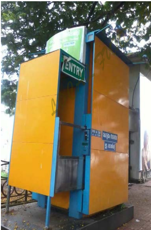
ഇ-ടോയ്ലറ്റ് - ഉപയോഗശൂന്യമായ നിലയിൽ.