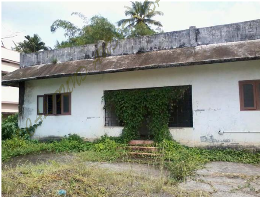
വിശ്രമമുറിയും ശൗചാലയവും കാടുകയറിയ നിലയിൽ

2009-10 വർഷത്തിൽ നിർമ്മാണം പൂർത്തീകരിച്ച കെട്ടിടവും വേയ് ബ്രിഡ്ജും പദ്ധതിയിൽ വിഭാവനം ചെയ്തിരുന്നതുപോലെ പ്രവർത്തനക്ഷമമായിട്ടില്ലാത്തതിനാൽ പദ്ധതി ഭൗതിക ലക്ഷ്യം കൈവരിച്ചിട്ടില്ല എന്ന് ഓഡിറ്റ് വിലയിരുത്തുന്നു. ഈ ആവശ്യത്തിനായി നിർമ്മിച്ച കെട്ടിടങ്ങളും അനുബന്ധ സാമഗ്രികളും നാശോന്മുഖമായ അവസ്ഥയിലാണ്.