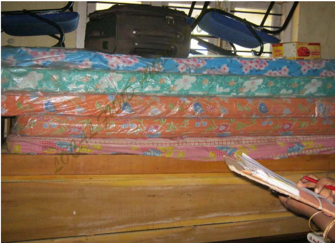
ചിത്രം - 3

ചിത്രം---1,2,3 പകൽ വീടിനായി വാങ്ങിയ ഫർണിച്ചറുകൾ നാളിതുവരെ ഉപയോഗപ്രദമാക്കാത്ത നിലയിൽ