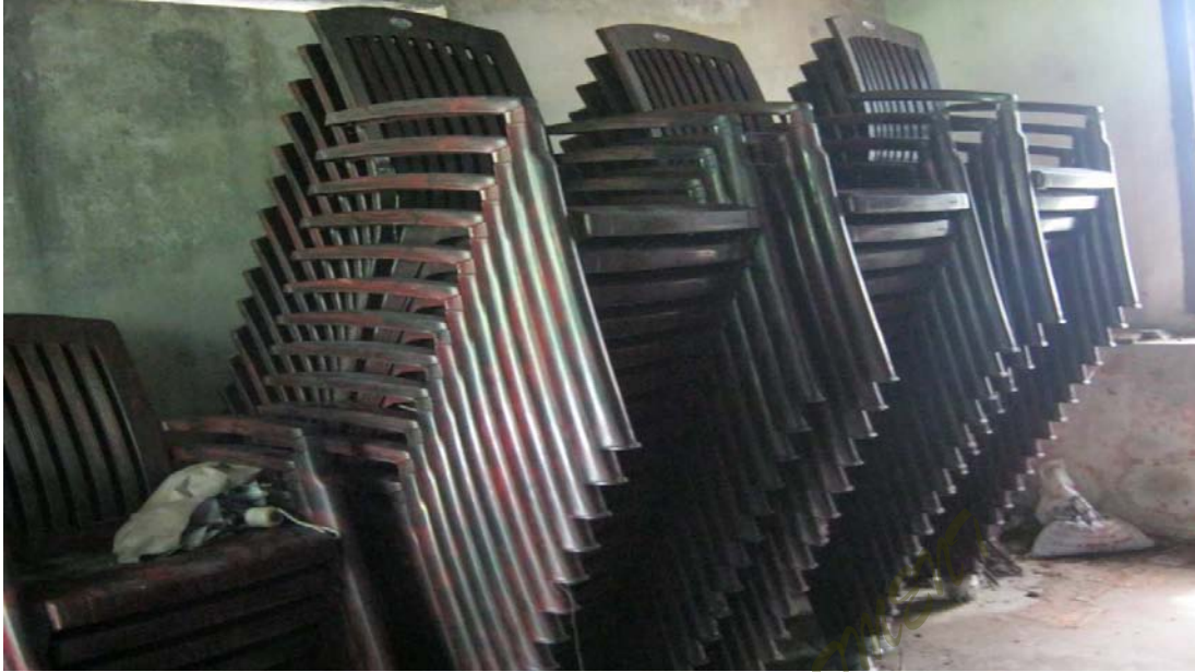
ചിത്രം - 2