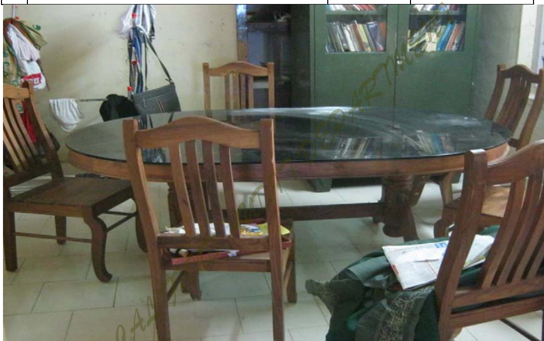
ചിത്രം - 1

പകൽ വീടിനായി വാങ്ങിയ ഊണുമേശയും കസേരയും മുനിസിപ്പൽ എഞ്ചിനീയറുടെ കാർട്ടേഴ്സിൽ ഉപയോഗിക്കുന്ന സ്ഥിതിയിൽ