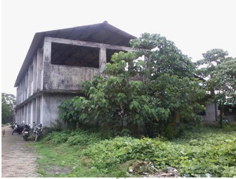
44.12 ലക്ഷം രൂപ ചെലവഴിച്ച അറവുശാലാ കെട്ടിടം